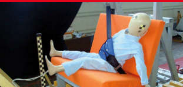
Результаты тестов использования небезопасных удерживающих устройств*

Дополнение определения «направляющая ляжка» в Правилах ЕЭК ООН № 44-04 было одобрено Всемирным Форумом (WP.29). Внесенная поправка к формулировке указывает на то, что « направляющая ляжка рассматривается как составной элемент детской удерживающей системы и НЕ может отдельно официально утверждаться в качестве детской удерживающей системы в соответствии с настоящими Правилами». Это исключает даже формальную возможность сертификации устройств типа «направляющая ляжка»!